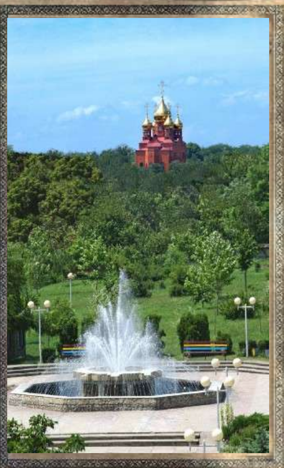
Сквер с фонтаном

Начиная с весны и до самых морозов сквер «горит» цветочными огнями. Дизайнерское оформление клумб, аккуратно подстриженные газоны, экзотические кустарники и деревья радуют глаз и поднимают настроение всем посетителям. Особой гордостью сквера является световой фонтан, сначала он был без цветных подсветок, а после реконструкции они появились. По многочисленным дорожкам бегают, катаются на роликах и велосипедах малыши, по вечерам собирается молодежь. Даже для молодоженов стало традицией фотографироваться в сквере.