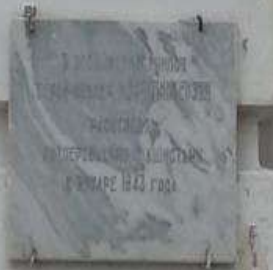
МБОУ школа № 1, им. А.В.Суворова