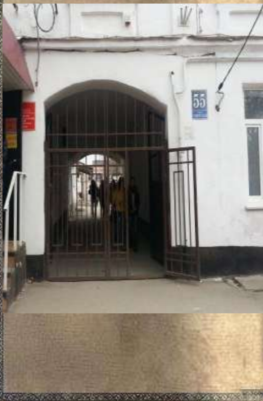
Социально- Педагогический колледж

Корпус с аркой — одно из зданий педучилища.