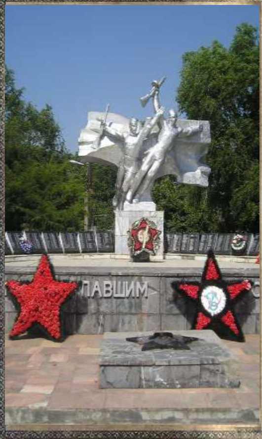
Воинский мемориал и Вечный огонь

Памятник и Вечный огонь напротив комплекса зданий Усть-Лабинской больницы являются центральным мемориалом, воздвигнутым в память о погибших земляках. Мемориал возведен на месте братской могилы бойцов, погибших при бомбежке железнодорожного вокзала. Памятный знак землякам погибшим в годы гражданской и Великой Отечественной войн и Вечный огонь был возведен в 1968 году. В 1985 году к 40-летию памятник был переделан