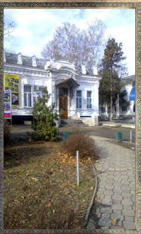
Социально- Педагогический колледж

Раньше Усть-Лабинское педагогическое училище, а еще раньше здесь располагалась Земская управа или атаманский дворец. Можно сказать, что это одно из самых красивых зданий города. Богато украшено рельефным орнаментом и объёмными дентикулами. Элегантный подъезд довершает эстетическое впечатление.