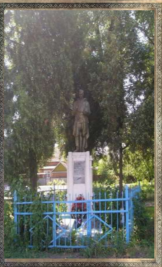
Братская могила советским воинам

Люди пережившие войну утверждают, что памятник установлен в память тех солдат, которые погибли при бомбежке вокзала немецкими самолетами.