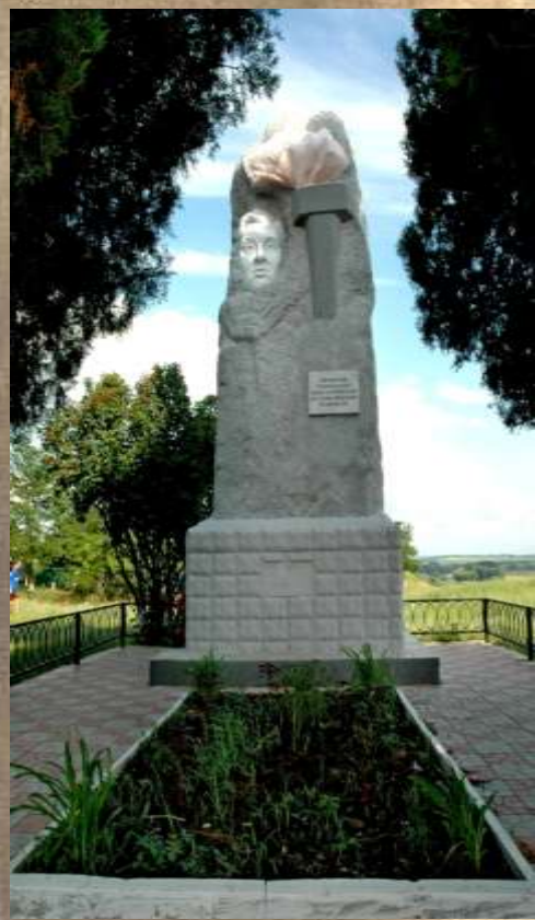
Памятник Муси Пинкензону

На втором полубастионе Александровской крепости на берегу Кубани находится могила. Скромный обелиск на месте захоронения был после освобождения города Усть-Лабинска.