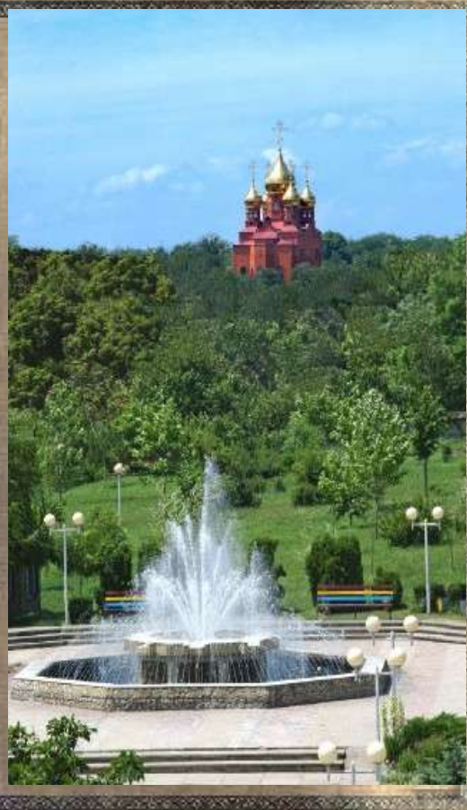
Сквер с фонтаном