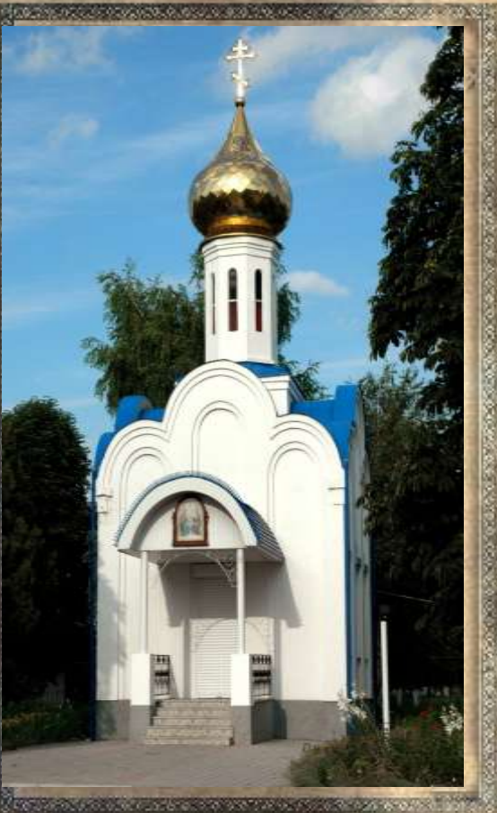
Часовня Пресвятой Троицы