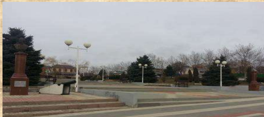
На центральном входе в сквер в 2013 году были установлены памятники А.Суворову и М.Клепикову.