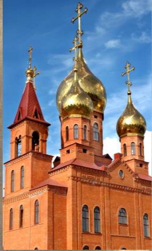
Храм Преподобного Сергия Радонежского