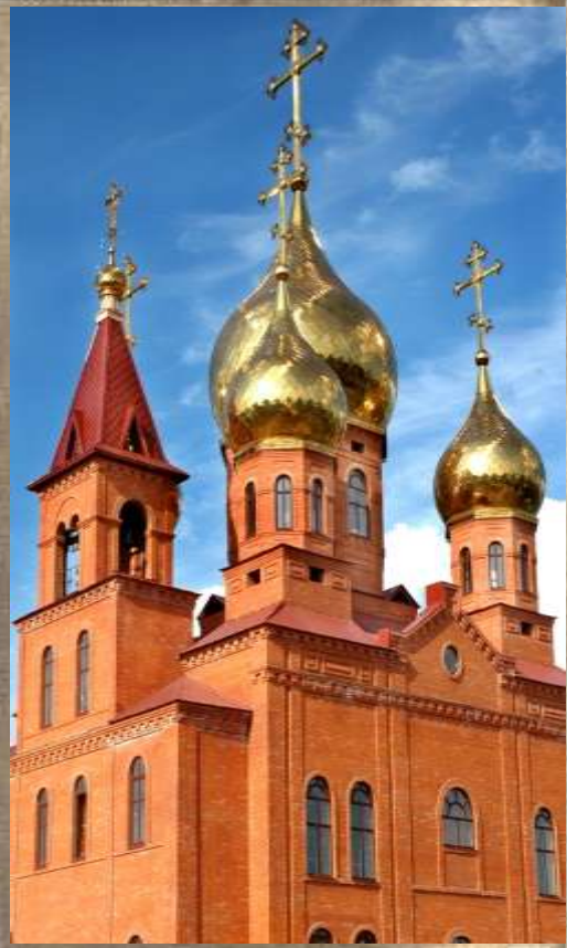
Храм Преподобного Сергия Радонежского

Храм однопрестольный. В 2002 году было выполнено много строительно-монтажных работ, 8 мая 2003 года Митрополит Екатеринодарский и Кубанский Исидор отслужил молебен и освятил строительство, крест, купол и колокол Храма, после чего колокол был установлен на колокольню.