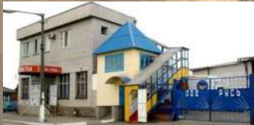
ООО "Русь" (хлебокомбинат)

ООО "Русь" (хлебокомбинат) – крупнейшее в районе предприятие по выпуску хлебобулочных изделий с производственной мощностью 64,3 т только хлебобулочных изделий в сутки. Помимо трех хлебных цехов, в структуру предприятия входят: кондитерский, колбасный, макаронный цеха и санитарная бойня. Предприятие выпускает 40 наименований хлебобулочных изделий.