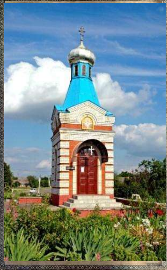
Часовня Святителя Николая Чудотворца.

Часовня Святителя Николая Чудотворца. Она находится на въезде в город со стороны Краснодара и пересечении с дорогой ведущей из соседней Адыгее.